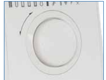
Elektronisches Funktionsrad Schnelles und einfaches Auswählen der Stiche