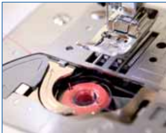
Unterfaden-Schnellautomatik Volle Spule einlegen, Faden einlegen und es kann losgehen

Automatisch Vernähen/Rückwärts – Verriegelungsstiche am Nahtanfang und -ende sichern die Naht und schaffen ein perfektes, professionelles Stichbild.