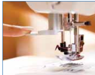
Automatischer Nadeleinfädler Ein Griff genügt und der Faden ist in der Nadel